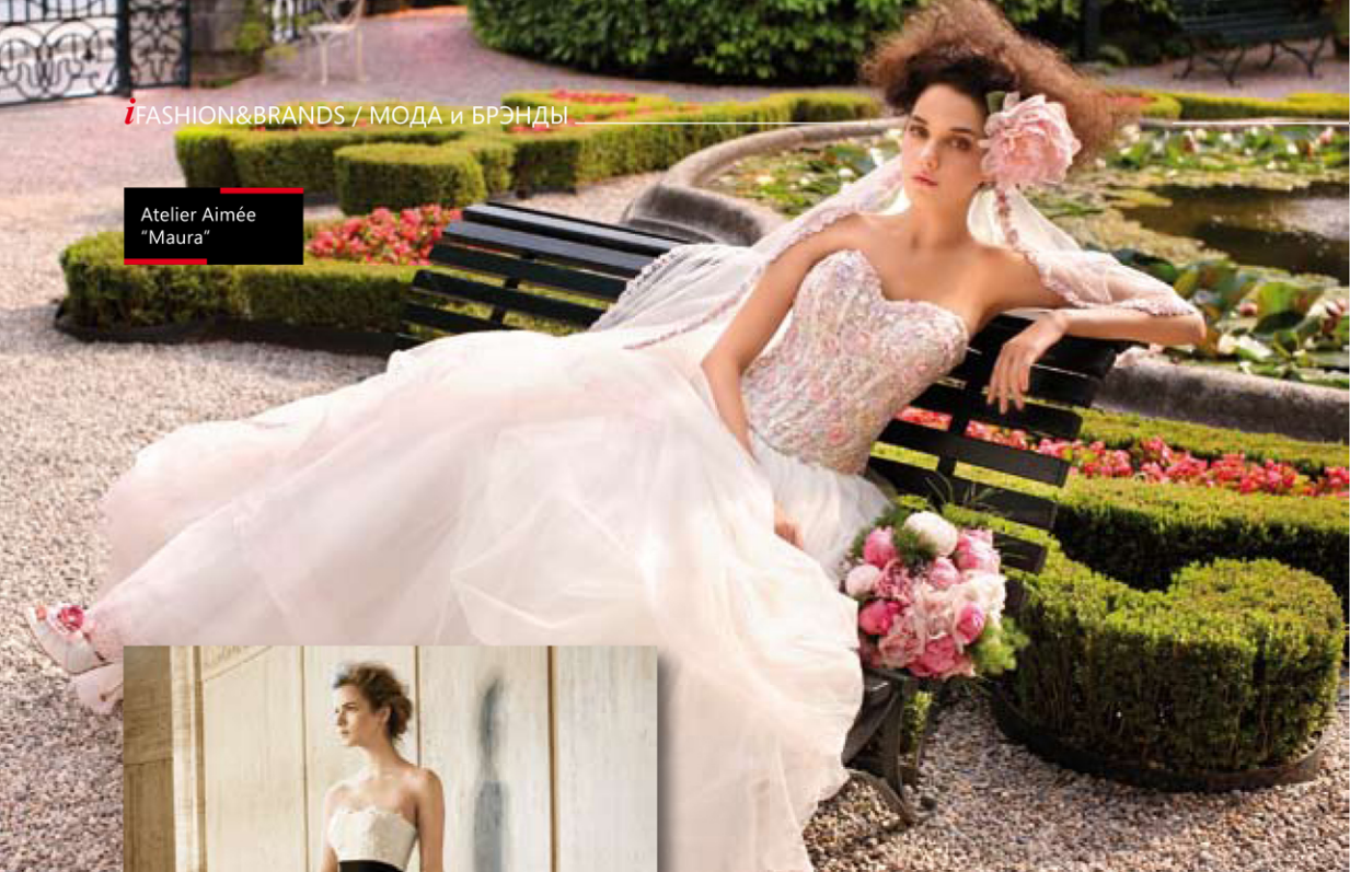
Atelier Aimée "Maura"